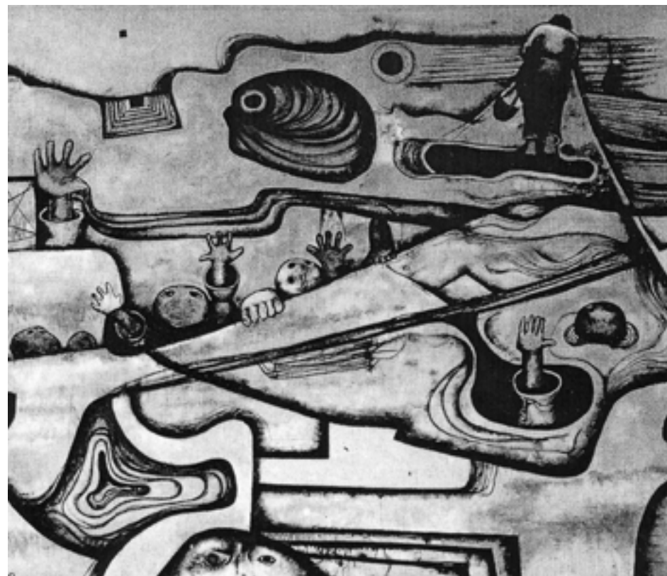
(「尾藤 豊 作品集」から)